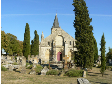
Eglise Saint-Pierre-de-la-Tour Du XIIe siècle