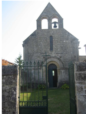
Eglise-notre-dame-de-la-nativité Du XIIe siècle Salles les Aulnay