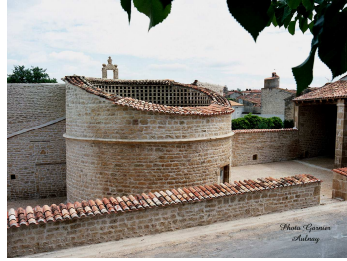
FUIE Colombier du XVe ou XVIe siècle