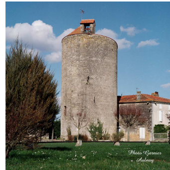
Donjon XIe siècle